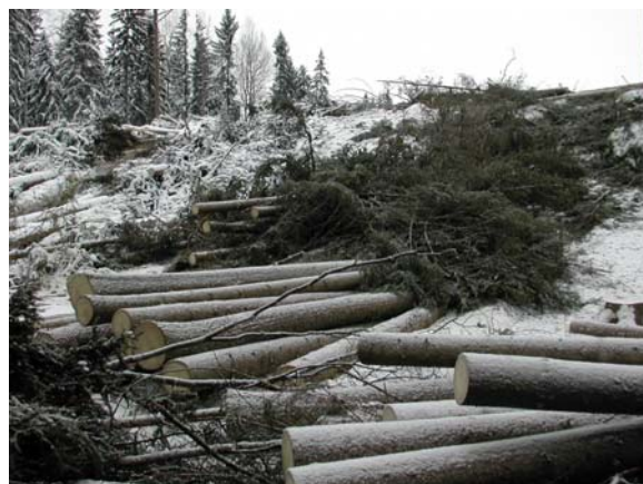
Figur 3. Avverkningsmönstret med timmer och "Långa toppar" parallellt med stickvägen.

Uppgifter om aktuella maskinkostnader, massaveds-, flispriser och provisioner har erhållits från Mellanskog och Naturbränsle i Mellansverige AB. Prisuppgifter och drivningskostnader framgår av bilagorna 1-3.