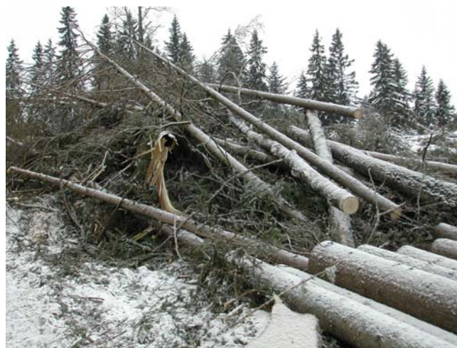
Figur 2. Exempel på en bränslehög (toppar, klenare träd och rötved) vid avverkningen i Rörshyttan.

Totalt mättes 230 toppar och träd i Rörshyttan (6,3% av antalet avverkade träd), 163 toppar och träd i Skenshyttan (3,5% av antalet avverkade träd) samt 232 toppar och träd i Sundborn (48,8% av antalet avverkade träd). Större bränslehögar fick delvis rivas isär för att mätningen av toppar och träd skulle kunna genomföras. Efter mätningen lades topparna och träden tillbaka i bränslehögen, dvs högarna återställdes i ursprungligt skick.