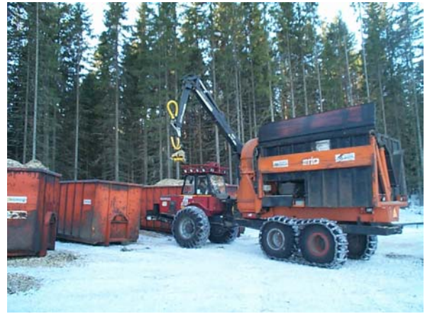
Figur 1. Toppar och klenare träd (under timmerdimension) flisas direkt på hygget, varefter flisen transporteras till avlägg och tippas i container.

Vid försökens genomförande lade skördaren såväl timret som topparna parallellt med stickvägen (arbetstekniska skäl), vilket innebär att flisskördaren fick köra i 90° vinkel mot stickvägarna när bränslehögarna flisades. Detta begränsar metodens tillämpbarhet i brant terräng och kan föranleda problem även i måttliga lutningar, eftersom flisskördaren då får arbeta i sidlut. Vid transporten av flis till avlägget användes samma vägar som vid transport av timret.